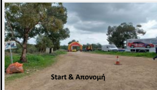
Start & Απονομή